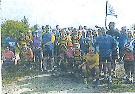
I podisti dell'associazione Amici della Croce d'Oro