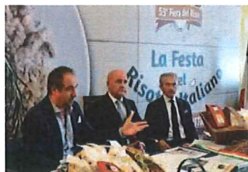
La presentazione della Fiera del Riso

settembre 4, 2019 4:37 pm Category: Basso Veronese, In evidenza, Manifestazioni, Manifestazioni, ultim'ora Scrivi un commento A+ / A-