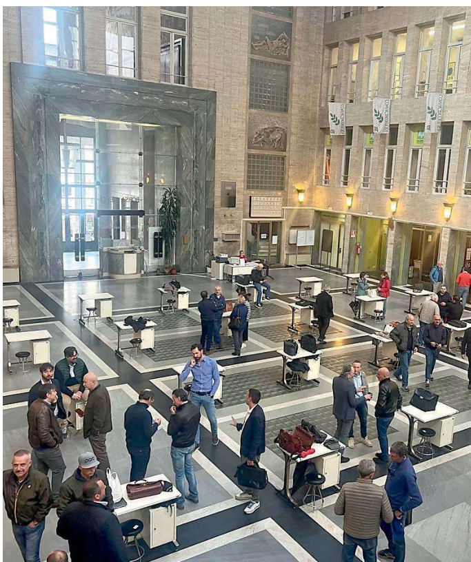
La sala del Palazzo dell'Agricoltura è stata scelta dalla nota catena di abbigliamento

Nel 2022 le architetture geometriche e i grossi obli della facciata principale avevano stregato il rapper Fabri Fibra, che insieme al regista Cosimo Alemà e il duo Colapesce-Dimartino aveva deciso di ambientarci il videoclip del brano «Propaganda». Due anni dopo la sede della Camera di Commercio di Vercelli e la sua Borsa Merci - la più importante in Europa per il settore risicolo, nonché uno dei fulcri della Fiera internazionale del riso di settembre 2025 - fanno di nuovo colpo. Questa volta ad ambientare uno shooting fotografico nello stabile in centro città è un marchio di moda italiano, Gutteridge 1878, storica firma anglo-napoletana nata quasi un secolo e mezzo fa da un piccolo negozio di Napoli. Oggi l'azienda, conosciuta in tutta Europa, fa parte del Gruppo Capri dal 1997, e ha deciso di utilizzare alcuni ambienti della Camera di Commercio come location per una campagna pubblicitaria. Le immagini dei modelli davanti agli obli di piazza Risorgimento, o i marmi grigi del piano terra della Borsa Merci, sono pubblicate sui canali social del brand, che conta 60 punti