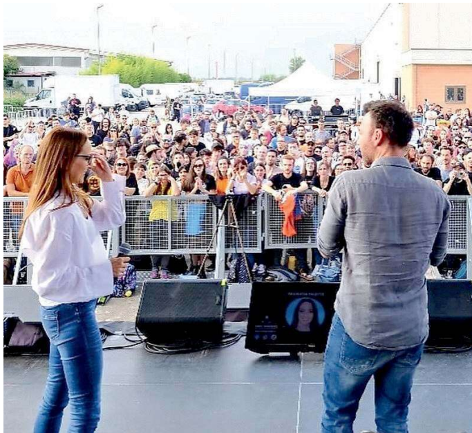
Un momento di «Gamics», la fiera dedicata al mondo pop e del fumetto

Il giorno prima sarà invece il turno di un altro volto noto del mondo dello spettacolo, specialmente degli appassionati delle trasmissioni di cucina: Simone Rugiati, celebre chef e pioniere dello show cooking italiano. Il protagonista dei canali televisivi dedicati al cibo e alle eccellenze italiane, con la sua passione per l'alimentare e la sua esperienza in progetti bio-green e agricoltura 2.0, sarà presente sul palcoscenico di Samarcanda e assisterà due chef di Vercelli che si sfideranno nella preparazione di una ricetta ideata proprio da lui. L'esibizione si terrà alle 20. La fiera campionaria sarà aperta al