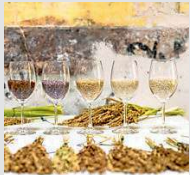
Varietà di riso in esposizione

La Strada del riso in stand ad Alba alla Fiera del tartufo