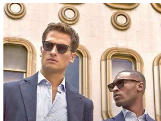
I modelli di Gutteridge nello sport in piazza Risorgimento