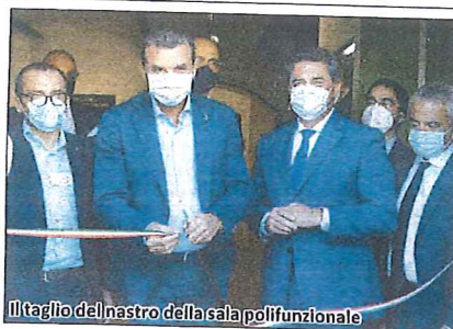
Il taglio del nastro della sala polifunzionale

le, Irrigue, dell'Industria, il presidente Paolo Carrà ha illustrato i primi 90 anni dell'Ente Risi sottolineando gli importanti obiettivi raggiunti e le sfide che ci si appresta a cogliere per difendere il settore, per confermarlo ai vertici mondiali per efficienza e sostenibilità. Sempre per i 90 anni dell'Ente è stata realizzata la pubblicazione "Dal 1931 il riso italiano" che attraverso immagini e testi racconta tutte le tappe dell'Ente Risi sempre a fianco della risicoltura italiana.