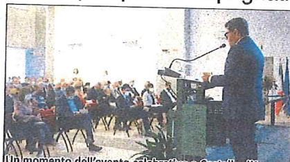
Un momento dell'evento celebrativo a Castello d'Agogna

Dal 2017 l'Ente Risi organizza il Forum del ri-